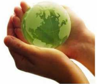
Schéma organisationnel de gestion et d'évacuation des déchets (SOGED), plan assurance environnement (PAE), Système de Management Environnemental (SME), charte de protection des milieux naturels, ... Autant de mesures qui sont aujourd'hui de plus en plus demandées, voire imposées par les appels d'offre pour répondre au respect de l'environnement dans un objectif de développement durable.

Dans l'objectif de suivre les directives de la norme internationale ISO 26000 sur la Responsabilité Sociétale des Entreprises (RSE), nous vous proposons notre expérience en ingénierie environnementale pour vous permettre de définir une politique performante de développement durable au cœur de votre structure.